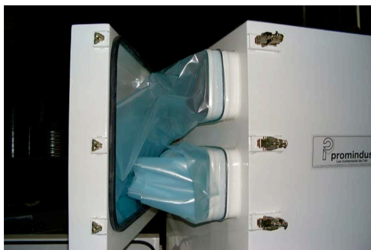
Logement housses d'extraction