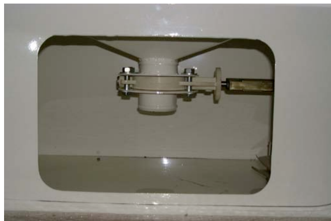
Goulotte sac vanne