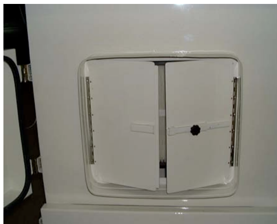
Porte accès cartouches