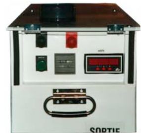
Débitmètre et compteur