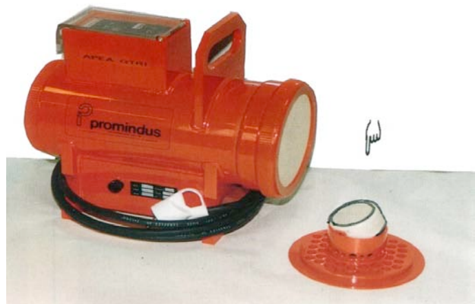
Cartouche Charbon actif

POUR LE PRELEVEMENT DE RADIO-IODES (STD ET SUPER)